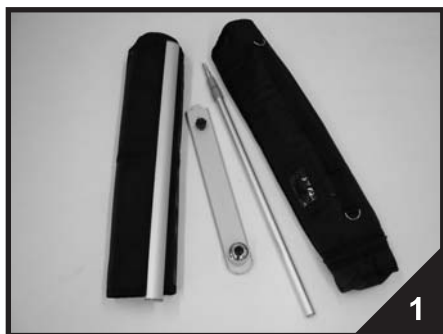
1. Obsah balení stojanu Nostalgik