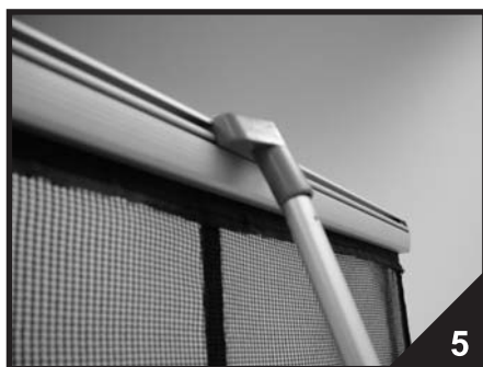
5. Horní profil podepřete podpěrnou tyčí.