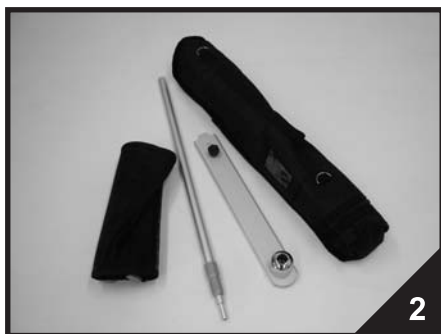
2. Obsah balení stojanu Fortuna