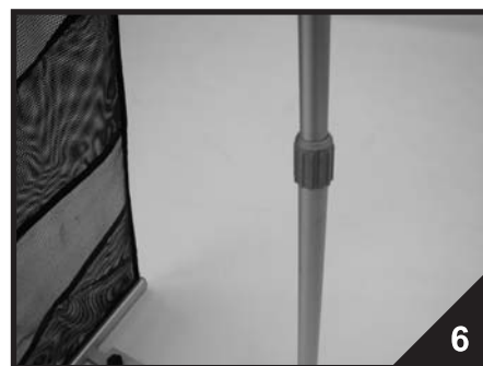
6. Otočením vlevo povolte teleskopickou tyč a vypněte stojan. Otočením vpravo zajistíte teleskopickou tyč.