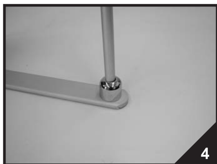
4. Teleskopickou tyč vložte do podpěrné nohy.